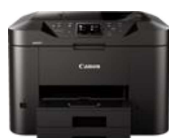
Řada MAXIFY MB2750